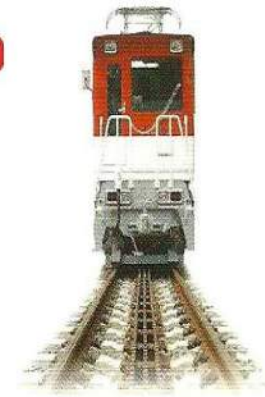
■アプト式区間 アプトいちしろ駅～長島ダム駅